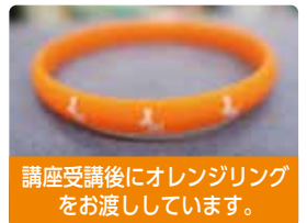
講座受講後にオレンジリングをお渡ししています。

認知症を正しく理解し、地域で暮らす認知症の方やそのご家族、お知り合いの方を温かく見守り、支援する応援者です。ご希望の方には、終了後の活動先をご紹介します。