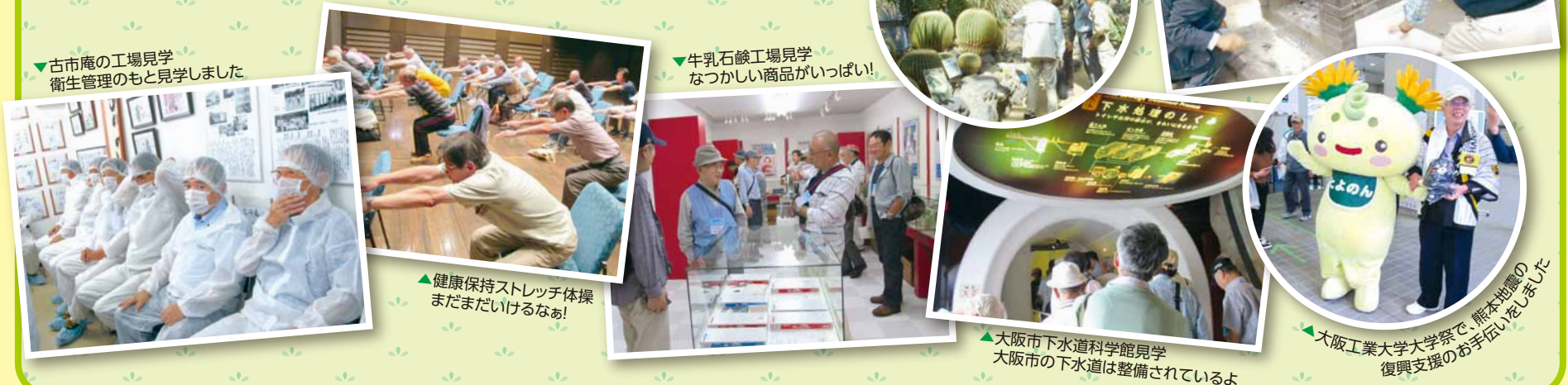
古市庵の工場見学 衛生管理のもと見学しました

男性専科「旭しょうぶ大学6回連続講座」を開催して、今年度で9年目となります。講座終了後、希望者で“OB会”を立ち上げて、男性の居場所、仲間作りの機会をつくり、地域への関心をもつ取組みや、ボランティア活動への参加など体験を通じて男性の地域参加への第1歩になるよう支援しています。