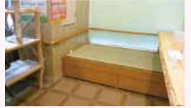
▲エントランスも改修しました