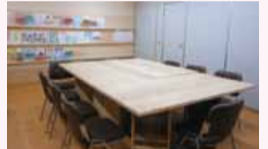
▲来られた方が見やすいように大きなチラシ入れを設置しました