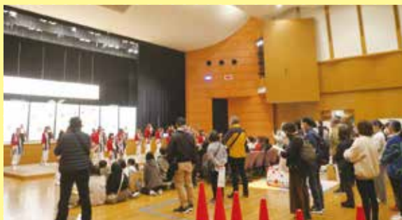
舞台コーナー よさこい披露

子どもから大人まで楽しむことのできる舞台コーナー、輪投げやストラックアウト、宝探しなどのお遊びコーナーを設け、約200人の方が参加されました。1階調理室ではこどもカフェも開催し、大盛況に終わりました。