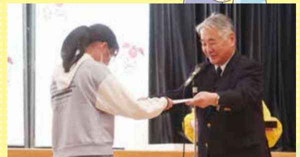
こどもカフェ こどもボランティアスタッフ表彰式