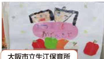
大阪市立生江保育所