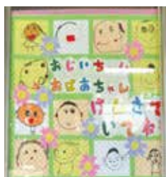
ありんこ第2保育園