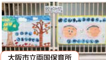
大阪市立両国保育所