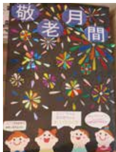
旭区在宅 デイサービスセンター

コロナ禍で直接会うことが難しい中、高齢者の方々が元気で過ごしていただけるよう、「いつまでも元気だね」「コロナにまけないで」などのメッセージとともに素敵な作品を作成いただきましたので、ご紹介させていただきます!