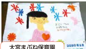
大宮まぶね保育園