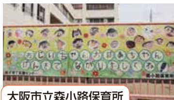
大阪市立森小路保育所