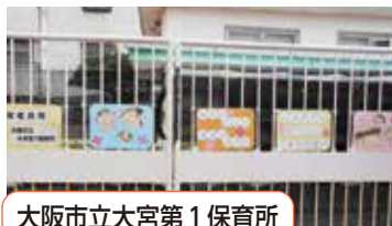
大阪市立大宮第1保育所